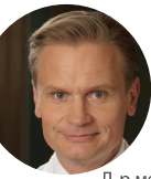
Проф. д-р мед. Улдис Мауриньш хирург, флеболог